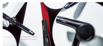
サロンシェアNo.1※1ブランド Nobby

そのNobbyをベースに、生活者の方がいかにプロのテクニックを再現できるかに注力して開発を続け、3年の歳月をかけて2017年11月に一般向けブランドNobby by TESCOMが誕生しました。Nobby by TESCOMは“プロ用”ではなく、誰でも簡単に“プロ同様”に仕上げるためのヘアケア製品をそろえた当社のフラッグシップブランドです。当ブランドのヘアードライヤー購入者の約95%が「満足している」※8と回答しています。