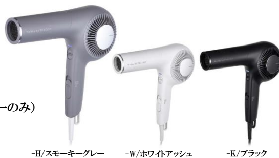
-H/スモーキーグレー -W/ホワイトアッシュ -K/ブラック

製品名：プロフェッショナル プロテクトイオン ヘアードライヤー 品番：NIB500A 発売日：2022年5月20日(金) URL： https://www.tescom-japan.co.jp/products/nib500a 販売先：新宿高島屋 Meetz STORE オンラインサイト (スモーキーグレーのみ) 全国の家電量販店・公式オンラインショップなど 価格：オープン 市場想定価格 ¥24,200 (税込) ※価格を表記する際は「編集部調べ」とご記載ください。 カラー：-H(スモーキーグレー) / -W(ホワイトアッシュ) / -K(ブラック)