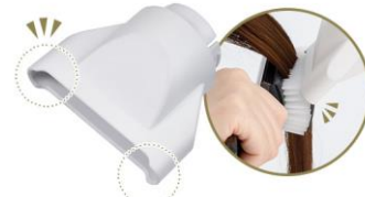
セットフード使用イメージ