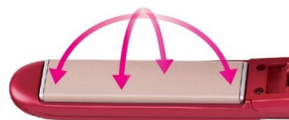
3D「びたっと」プレート イメージ