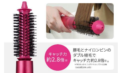
豚毛ロールブラシ

豚毛とナイロンピンをダブル植毛で、キャッチ力が約2.8倍※3にアップしました。直径55mmの太めのロール径で、髪をしっかりキャッチしながらふんわりとしたカールがつけれます。また、従来品と比較して、髪表面温度に配慮し、低温でスタイリングすることが可能になりました。熱ムラが少なく、髪に均一に熱を与えられるため、まとまりのあるきれいなカールがつけれます。ロングブラシで、ミディアム・ロングヘアや毛量の多い方でも使いやすい設計です。