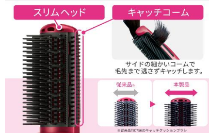
ワイドキャッチブラシ