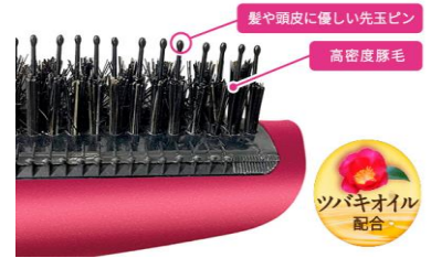
豚毛ブローブラシ

硬さの異なる硬質猪毛と軟質豚毛の2種類の天然毛を独自の配合でブレンド。太くて固い硬質猪毛が髪のをしっかりキャッチし、柔らかくしなやかな軟質豚毛が髪をやさしくいたわりながらブラッシング。心地よい櫛通りで、サロンブローのようなまとまりのあるつややかな髪へ導きます。また、根元をすくい上げるようにして風をあてれば、簡単にトップにボリュームが出せます。