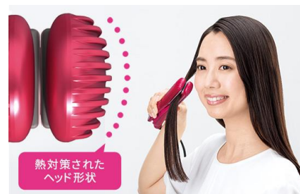
熱対策された ヘッド形状