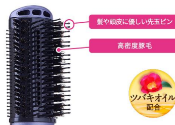
豚毛ブローブラシ

また、根元をすくい上げるようにして風をあてれば、簡単にトップにボリュームが出せます。