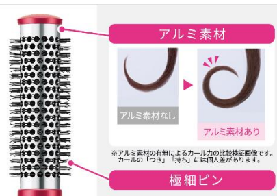
ロールアイロンブラシ