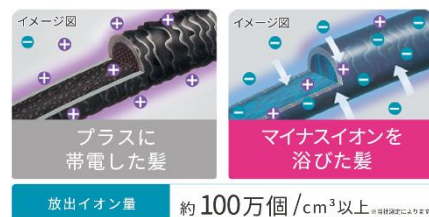
プラスに 帯電した髪