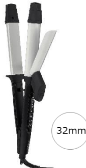
2WAY ヘアアイロン TW303A