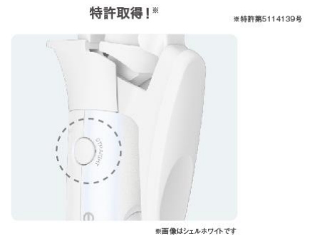
ワンタッチで切り替えできる テスコム独自構造