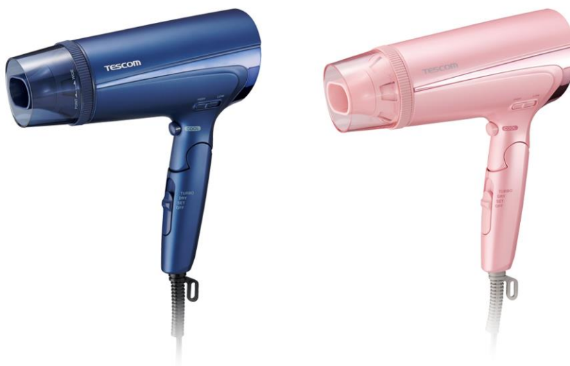
プロテクトイオン ヘアドライヤー TD465A （-A ネイビー / -P ピンク）