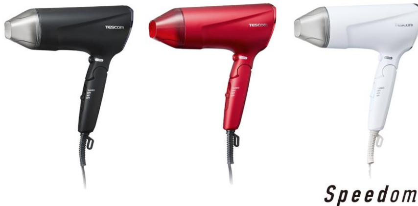
プロテクトイオン ヘアドライヤー TD570A