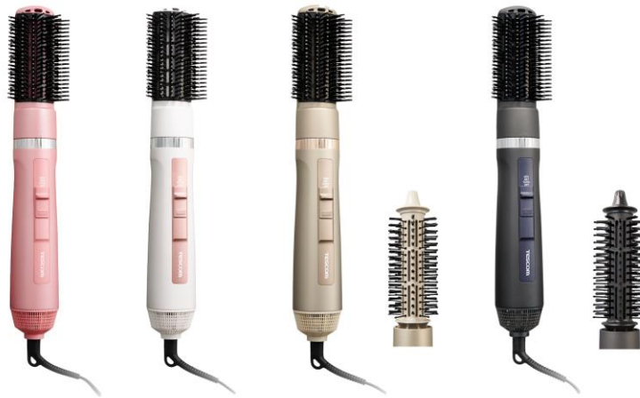
左：TC360A -P（ピンク） / -W（ホワイト）

テスコム電機株式会社（本社：東京都品川区、取締役社長：柴田 幸生、以下テスコム）は、ブローの仕上がりをワンランク上げる2種類のブラシで、まとまりのある髪へと導く「マイナスイオン カールドライヤー TC360A/TC365A」を、2024年2月中旬より発売いたします。