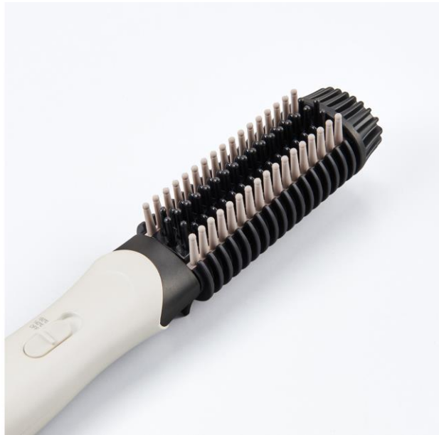
マイナスイオン コンパクトブラシアイロン TB460A