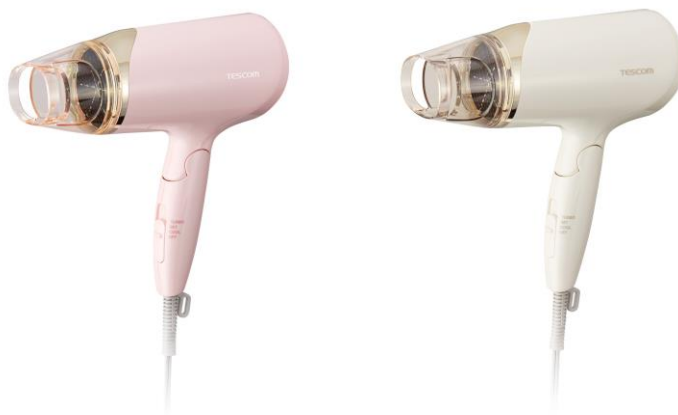
マイナスイオン ヘアドライヤー TD260A