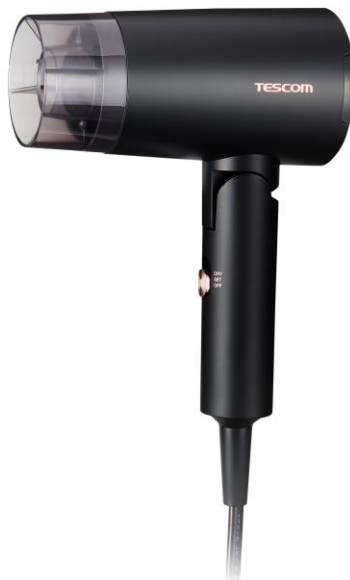
マイナスイオン ヘアドライヤー TD565A