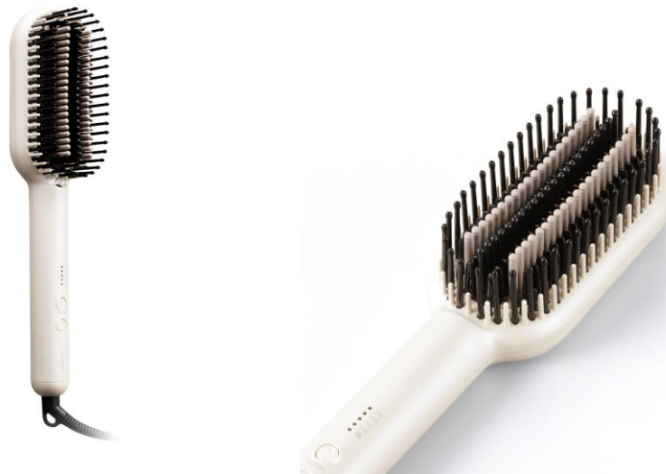
マイナスイオン ストレートブラシアイロン TB560A

テスコム電機株式会社（本社：東京都品川区、取締役社長：柴田 幸生、以下テスコム）は、シリコンピンで髪をしっかりとキャッチし、ブラシでとかすだけで簡単に美しいストレートヘアへと導く「マイナスイオン ストレートブラシアイロン TB560A」を3月下旬より発売いたします。