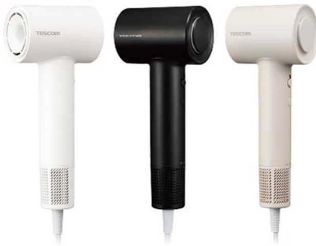
マイナスイオン ヘアドライヤー TD760A

テスコム電機株式会社（本社：東京都千代田区区、取締役社長：柴田 幸生、以下テスコム）は、高速ブラシレス DC モーターによる大風圧、軽量・コンパクト設計、低騒音で、ヘアドライのストレスから開放する「マイナスイオン ヘアドライヤー TD760A」を、2024年5月下旬より順次発売いたします。